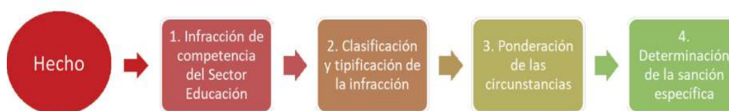
Figura 1. Esquema del proceso de determinación de sanciones

Con el objetivo de dotar de mayor predictibilidad al procedimiento administrativo sancionador y mejorar el carácter compensatorio de las sanciones, la imposición de estas en el ámbito del presente Reglamento debe seguir el esquema propuesto en la Figura N° 1 .