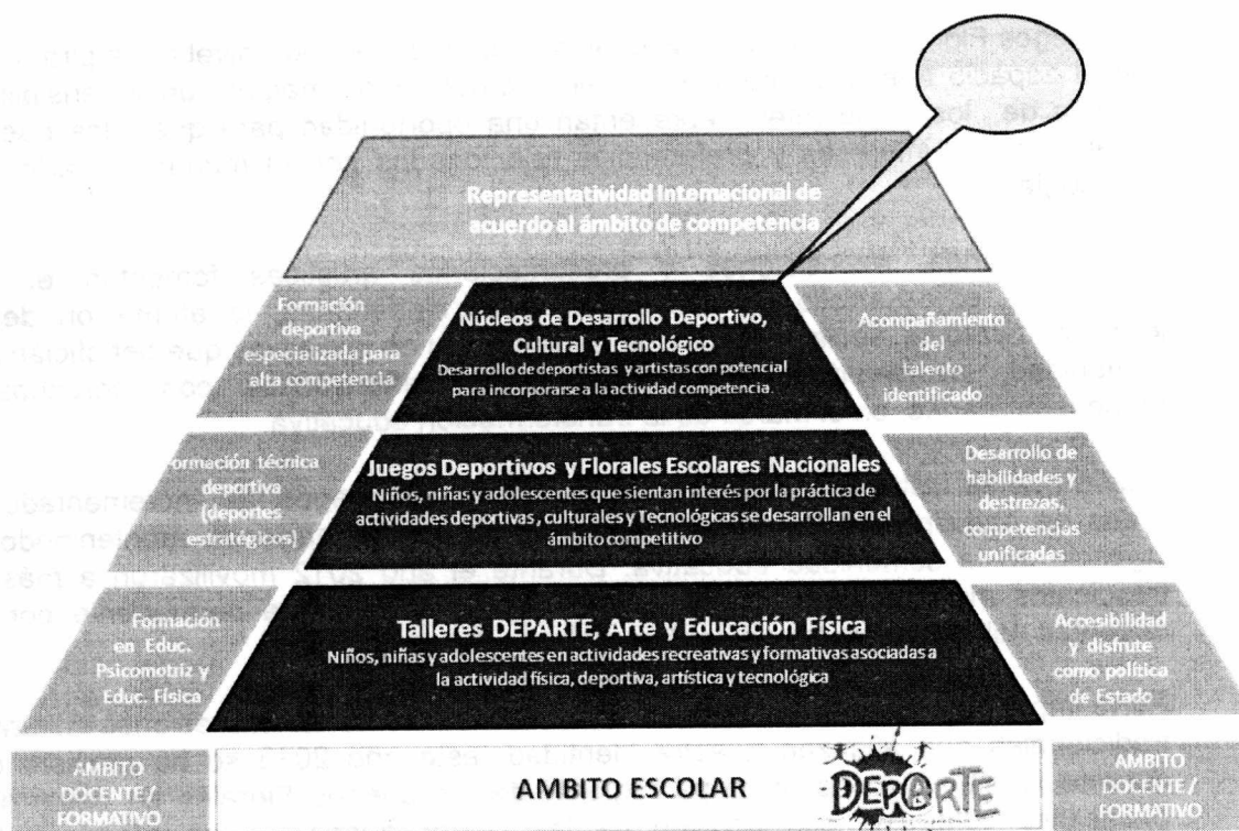
Estructura piramidal del Programa DEPARTE

Los Juegos Florales brindan al estudiante la posibilidad de proyectarse más allá del sistema educativo al considerar para el presente año el establecimiento de alianzas con entidades e instituciones vinculadas al sector cultural nacional e internacional como el Ministerio de Cultura, la Organización de Estados Iberoamericanos para la Educación, la Ciencia y la Cultura – OEI y la Fundación Internacional para el Arte Infantil – ICAF; al darle la oportunidad de participar en eventos culturales de mayor envergadura y alcance internacional.